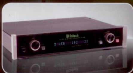
McIntosh D100 Cyfrowy przedwzmacniacz stereo/DAC, tani jak na tego producenta