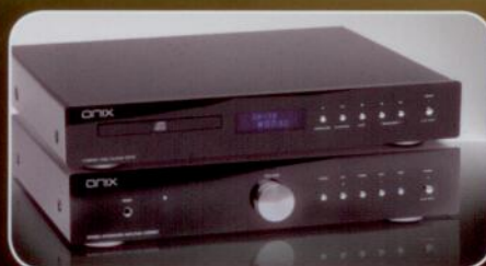
Onix CD-10 i A-55 MkI Elegancki system stereo bazujący na elementach wysokiej klasy