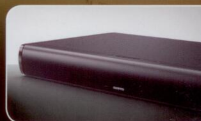
Onkyo LS-T10 Solidny soundbar z dodatkowymi głośnikami umieszczonymi po bokach